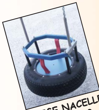
SIÈGE NACELLE Réf: 4080.03

Fixations haute sur demande, basse avec chaîne et support 4080.09