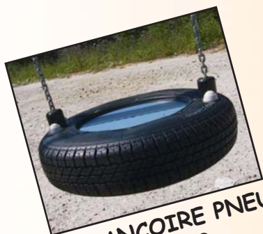
BALANCOIRE PNEU Réf: 4080.02

Siège de balançoire avec assiette en panneau HPL. Montage robuste suspendu sur chaîne galvanisée. Longueur: 250 cm