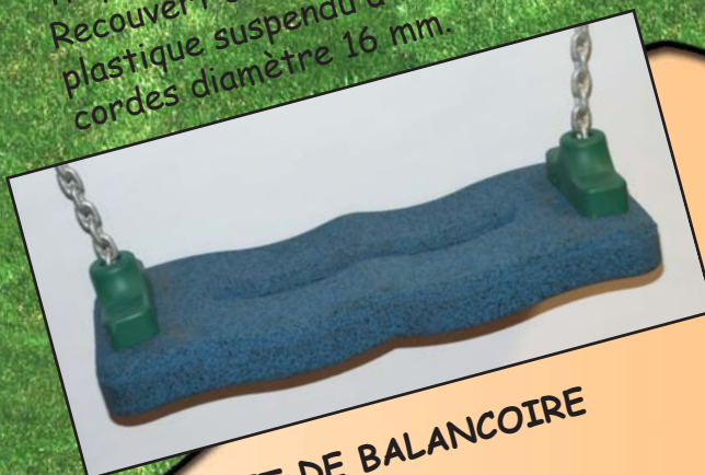
PLACET DE BALANCOIRE Réf: 4080.04

Paire d'anneau, hauteur réglable. Pose avec fixation 4080.01 nécessaire