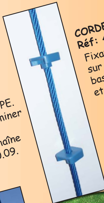
CORDE A NOEUDS Réf: 4080.08

Echelle avec échelon en PE. Fixation haute à déterminer selon structure. Fixation basse avec chaîne et support, réf: 4080.09. Longueur: 250 cm.