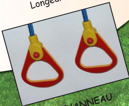
PAIRE D'ANNEAU Réf: 4080.07

Trapèze en tube Inox. Recouvert d'une protection plastique suspendu à des cordes diamètre 16 mm.