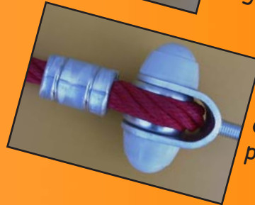
Réf: 4080.16 Chape Inox avec poulie