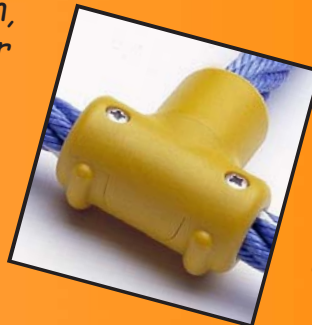
Réf: 4080.13 Té d'assemblage de filet. Nécessité d'utilisation avec des douilles 4080.14