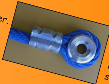
Réf: 4080.17 Poulie sertie, diamètre perçage 13 mm. Permet la fixation en applique ou s'adapte dans la chape, réf: 4080.16