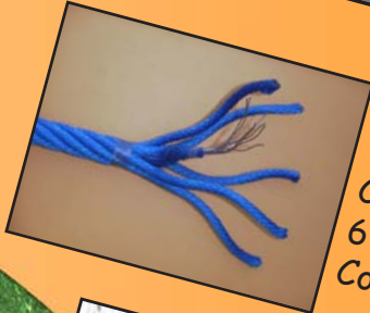
Réf: 4080.10 Corde diamètre 16 mm, 6 torons armée de câble acier. Coloris: bleu, vert ou rouge