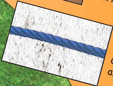
Réf: 4080.11 Corde diamètre 28 mm, armée de câble en acier