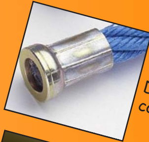
Réf: 4080.14 Douille à sertir pour corde diamètre 16 mm