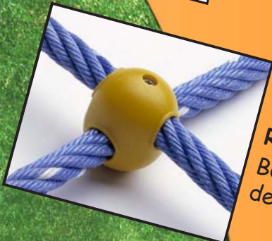
Réf: 4080.12 Boule d'assemblage de filet