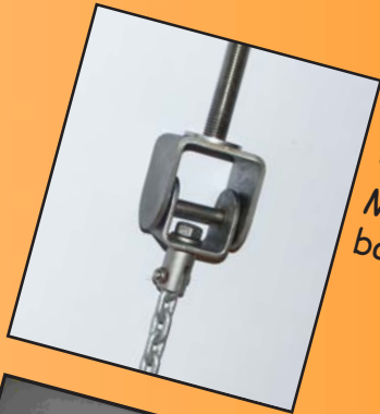
Réf: 4080.21 Mouvement de balançoire rotatif