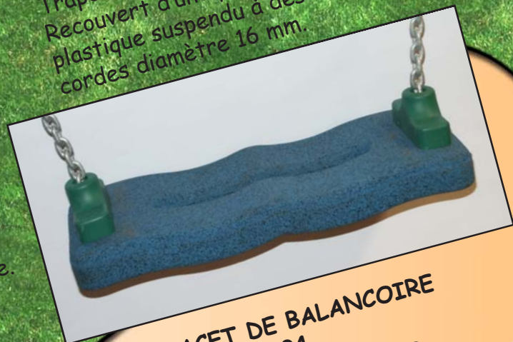
PLACET DE BALANCOIRE Réf: 4080.04

Paire d'anneau, hauteur réglable. Pose avec fixation 4080.01 nécessaire