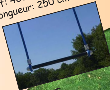
TRAPEZE Réf: 4080.06

Siège en pneu. Montage robuste suspendu sur chaîne galvanisée. Longueur: 250 cm