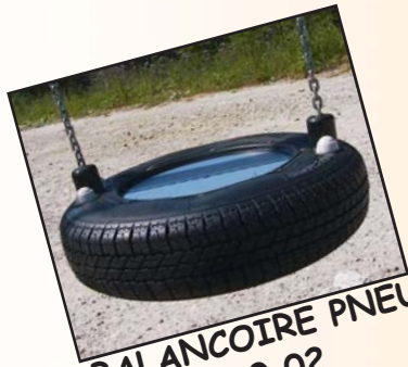
BALANCOIRE PNEU Réf: 4080.02

Siège de balançoire avec assiette en panneau HPL. Montage robuste suspendu sur chaîne galvanisée. Longueur: 250 cm