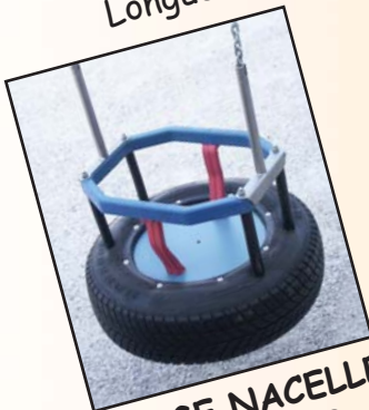
SIEGE NACELLE Réf: 4080.03

Fixations haute sur demande, basse avec chaîne et support 4080.09