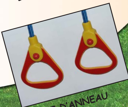
PAIRE D'ANNEAU Réf: 4080.07

Trapeze en tube Inox. Recouvert d'une protection plastique suspendu à des cordes diamètre 16 mm.