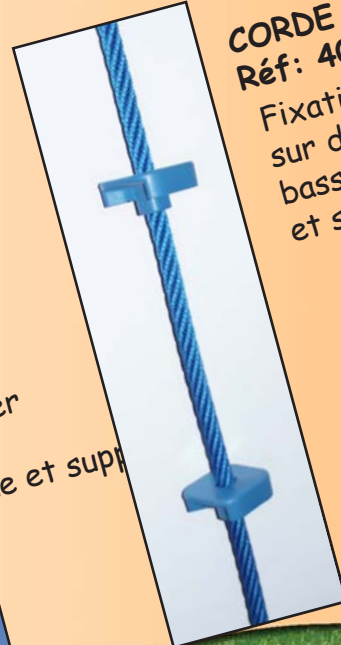
CORDE A NOEUDS Réf: 4080.08

Echelle avec échelon en PE. Fixation haute à déterminer selon structure. Fixation basse avec chaîne et support réf: 4080.09. Longueur: 250 cm.